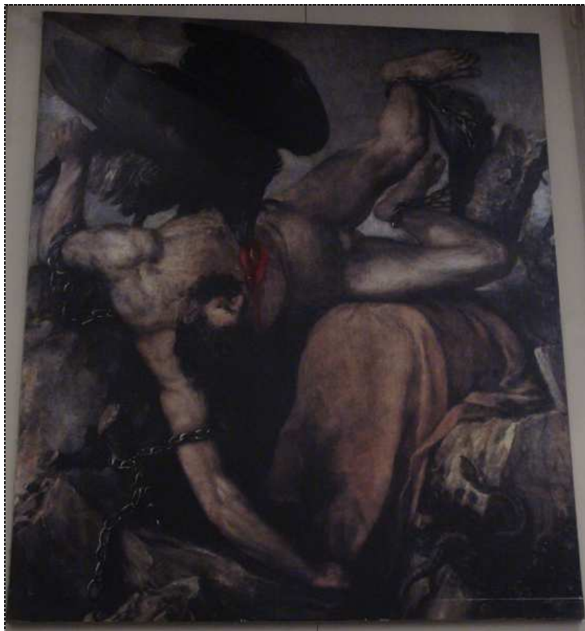
«ΠΡΟΜΗΘΕΑΣ ΔΕΣΜΩΤΗΣ» ΚΕΝΤΡΙΚΗ ΑΙΘΟΥΣΑ ΤΗΣ ΟΡΘΟΔΟΞΟΥ ΑΚΑΔΗΜΙΑΣ ΚΡΗΤΗΣ “PROMETHEUS BOUND” THE CENTRAL HALL OF THE ORTHODOX ACADEMY OF CRETE