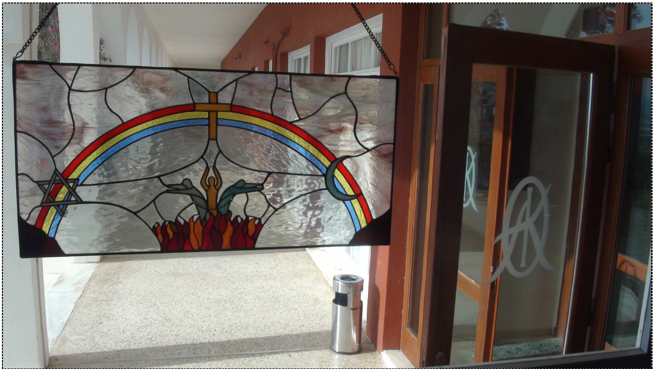
ΕΙΣΟΔΟΣ ΤΗΣ ΟΡΘΟΔΟΞΟΥ ΑΚΑΔΗΜΙΑΣ ΚΡΗΤΗΣ THE ENTRANCE OF THE ORTHODOX ACADEMY OF CRETE