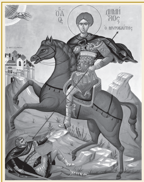
Αγιογραφία δια χειρός Δομετίου μοναχού

Αναχώρηση της Ιεράς και θαυματουργού Εικόνας Παναγίας της Τρυπητής για την πόλη του Αιγίου.